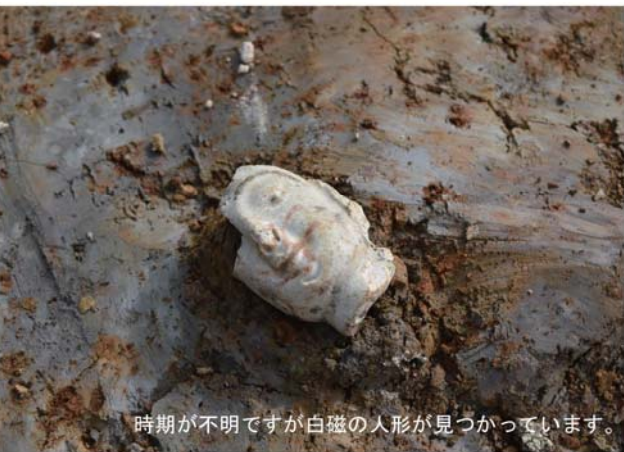
時期が不明ですが白磁の人形が見つっています。