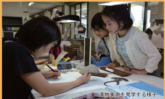
遺物実測を見学する様子

このイベント満足度は、なんと平均 92.7 点！特に小学生に限ると平均 97.4 点で、スタッフ一同感動の涙に濡れました。これからも可能な限り、調査成果を還元し、少年・少女の皆さんにも文化財や考古学、歴史の面白さをお伝えしていきたいと思ひます。