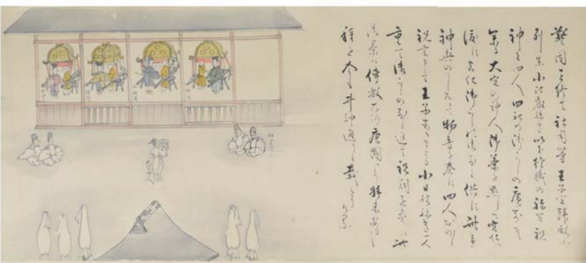
献茶式図（絵）と詞書

琵琶湖文化館のホームページでは、収蔵品を紹介する「浮城物語」を連載しています。その中のひとつが上の資料です。日吉大社の山王祭（日吉祭）は、現在でも延暦寺の天台座主が神前読経を行うなど神仏習合を色濃く残すお祭りとして有名です。 そして本品は、神仏分離以前（江戸時代）の山王祭の様相を知ることができる貴重な例で、各儀礼を網羅的に描いた全長約 20m の絵巻です。また、絵だけでなく、それを詳しく説明した日吉大社の神職による詞書（ことばがき）がともに記