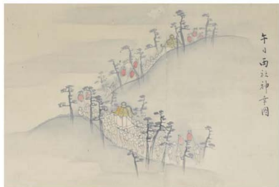
午日両社神行図（部分）