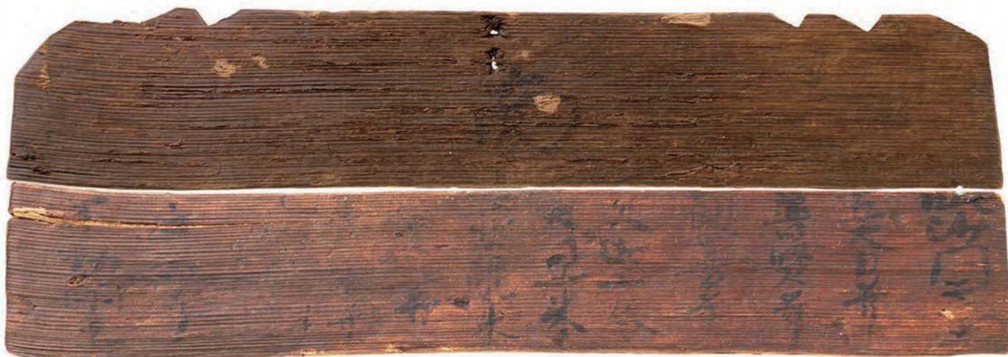
◆賀田山遺跡出土勸請板

写真の勸請板は、土坑(穴)から出土しました。勸請板(巻数板:かんじょういた)とは、厄災から護るための結界の札で、この出土品は、仏の名を書き連ねることで聖なる力を持たせています。