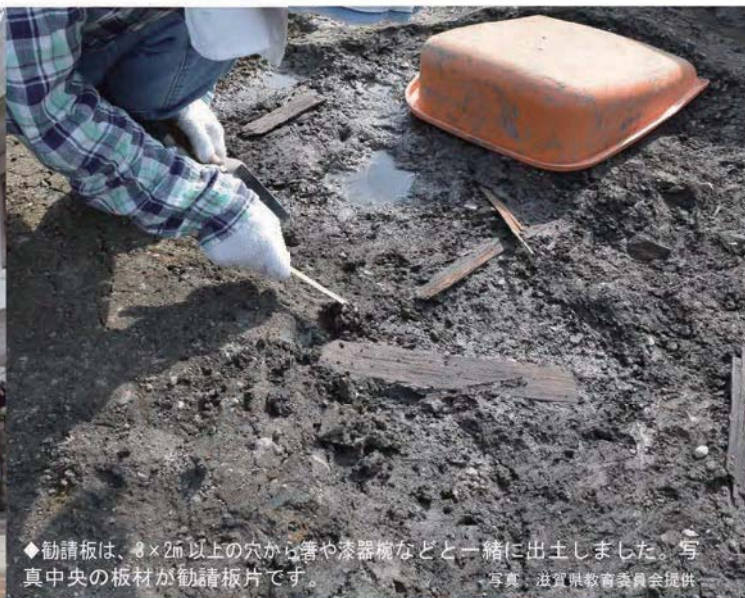
◆勸請板は、 \phi 2m 以上の穴から箸や漆器板などと一緒に出土しました。写真中央の板材が勸請板片です。