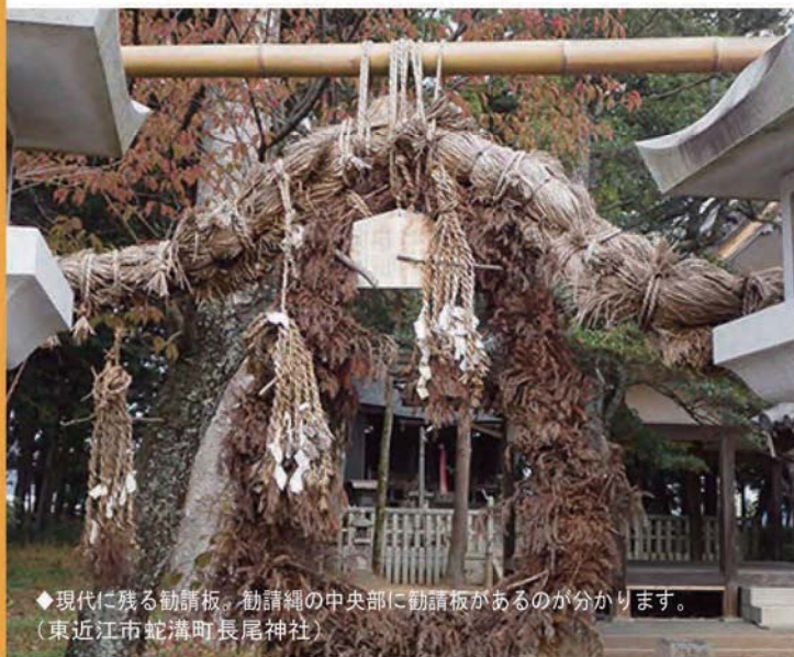
◆現代に残る勸請板。勸請縄の中央部に勸請板があるのが分かります。(東近江市蛇溝町長尾神社)