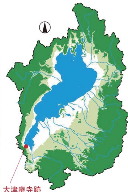
* 写真：滋賀県教育委員会提供

■ みつかった「大津百町」 今年の5～7月にかけて滋賀県庁前にある大津廃寺跡の発掘調査を実施しました（写真上）。大津廃寺跡は、周辺で古代瓦が出土することから主に古代寺院跡の存在が推定されていますが、今回の調査地点では、江戸時代の水道施設が良好な状態でみつかりました。周辺は、江戸時代に「大津百町」と呼ばれた市街地が形成されていました。