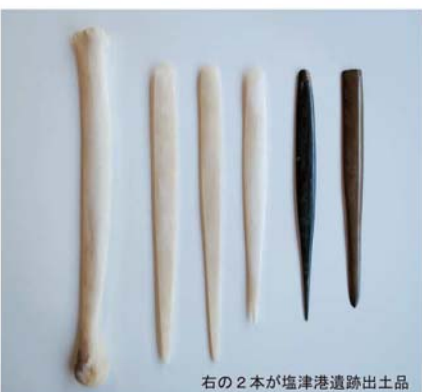
右の 2 本が塩津港遺跡出土品

● 本誌の掲載情報は平成 30 年 1 月 1 日現在の情報です。諸般の事情により内容が変更される場合がありますので、お出かけの際はご確認下さい。