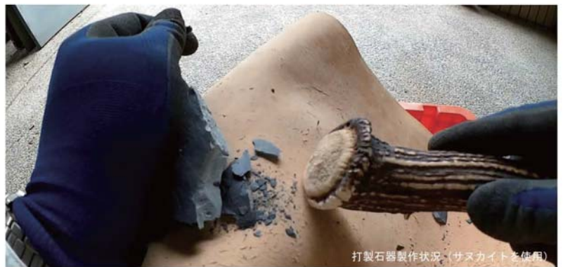
打製石器製作状況（サヌカイトを使用）