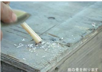
鹿の骨を削ります

■ 本物に挑戦！ 滋賀県内の遺跡からは様々な遺物が出土しています。この体験講座では、出土品と同じような素材をつかってつくります。夏休みに子供向け体験学習を実施していますが、今回は大人向けの本格的な体験で、難易度が高い講座となっています。