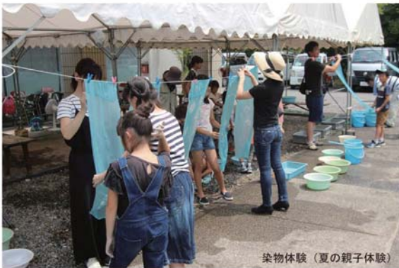
染物体験（夏の親子体験）