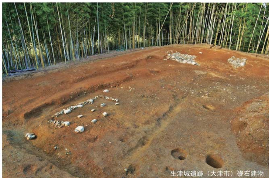
生津城遺跡（大津市）礎石建物