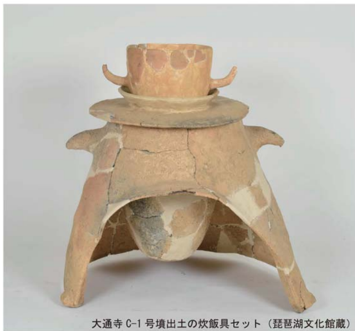
大通寺 C-1 号墳出土の炊飯具セット（琵琶湖文化館蔵）

■掘り出し物を発見！ 琵琶湖文化館のホームページ ( http://www.biwakobunkakan.jp/ ) では、収蔵品を紹介する「浮城モノ語り」を連載しています。今回はその中から、大津市滋賀里の大通寺古墳群から出土した実用サイズの炊飯具セットをご紹介します。