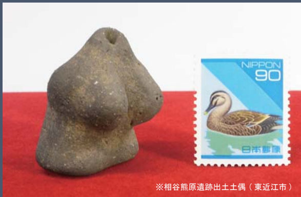
※相谷熊原遺跡出土土偶 (東近江市)