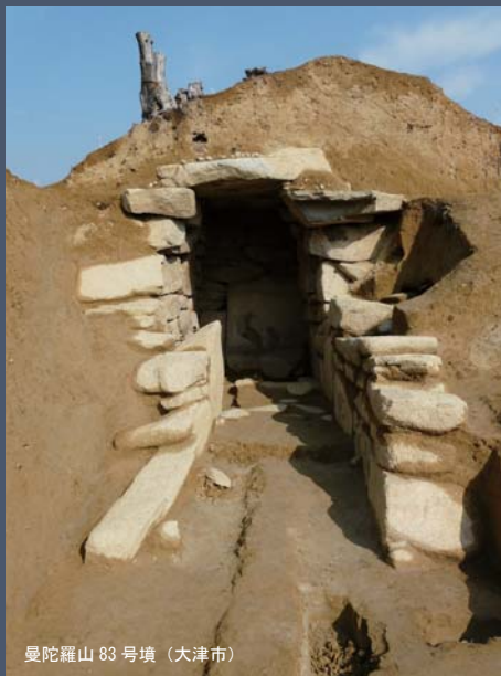
曼陀羅山 83 号墳 (大津市)