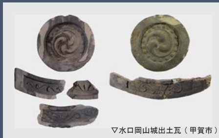
▽水口岡山城出土瓦 (甲賀市)