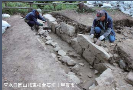
▽水口岡山城東櫓台石垣 (甲賀市)