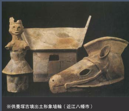
※供養塚古墳出土形象埴輪 (近江八幡市)