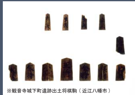
※観音寺城下町遺跡出土将棋駒 (近江八幡市)