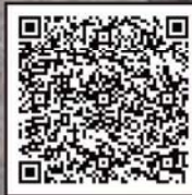
現在の蜂屋集落には？