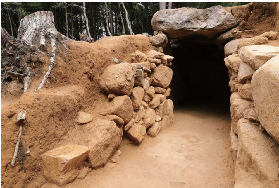
福林寺古墳群 3号墳の横穴式石室

六世紀後半から七世紀初めにかけて野洲の山麓部には、横穴式石室をもつ小さな古墳が数多く築かれました。福林寺古墳群の発掘成果から、そこで執り行われた葬送儀礼に迫ります。