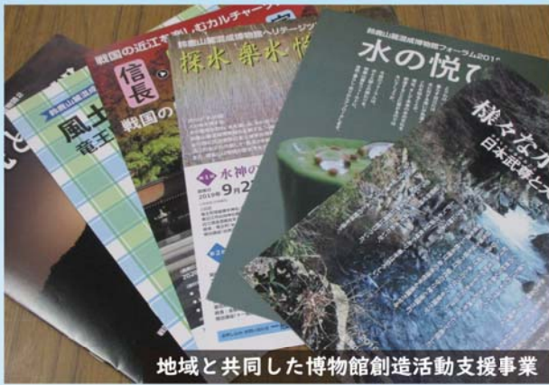
地域と共同した博物館創造活動支援事業