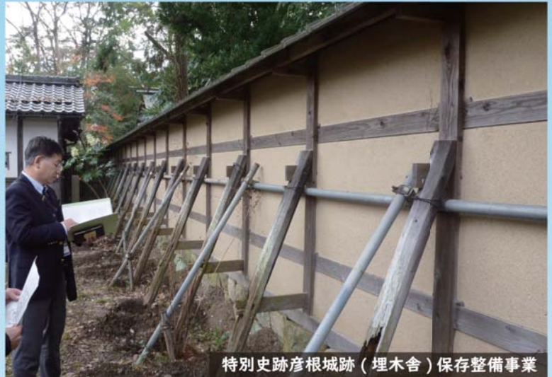
特別史跡彦根城跡（埋木舎）保存整備事業