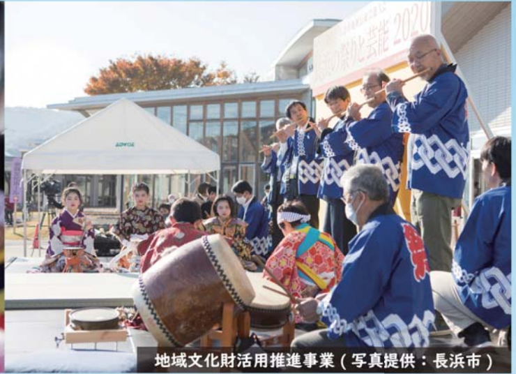
地域文化財活用推進事業