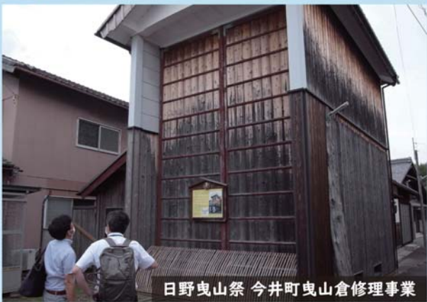
日野曳山祭 今井町曳山倉修理事業