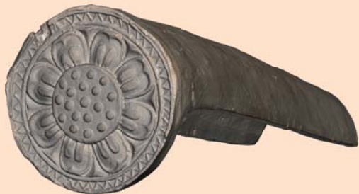
飛鳥時代の軒丸瓦

今から約 1,300 年前にお寺が建てられていた蜂屋遺跡（栗東市）。 お寺が無くなったのは教科書にも出てくるある人物が関わっていた？ その謎にも迫ります。