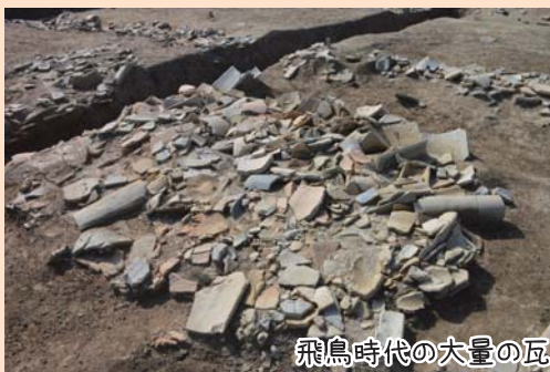
飛鳥時代の大量の瓦