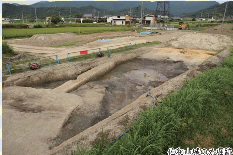
佐和山城の外堀跡