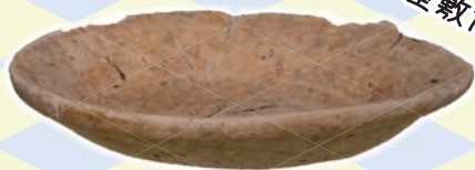
朽木陣屋跡出土 土師器 皿

今回は4年ぶりにガラス越しではなく、間近で作業や出土した土器などを見ることができます。 夏季企画展「発掘された近江皿」と合わせて近江の安土桃山時代を詳しく知ろう！ イベント詳細は裏面へ！