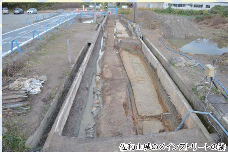
佐和山城のメインストリートの跡