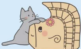
しびーちゃん&にゅあ