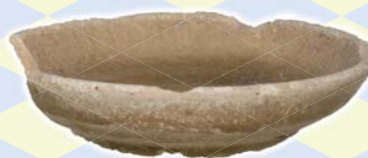
佐和山城跡出土 瀬戸美濃焼 皿