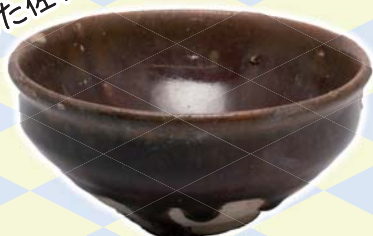
佐和山城跡出土 天目椀