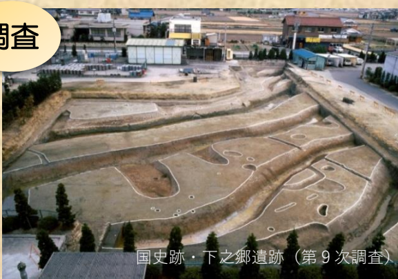
国史跡・下之郷遺跡（第9次調査）