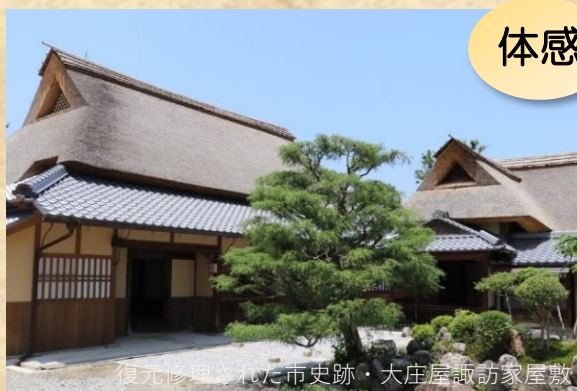
復元修理された市史跡・大庄屋諏訪家屋敷