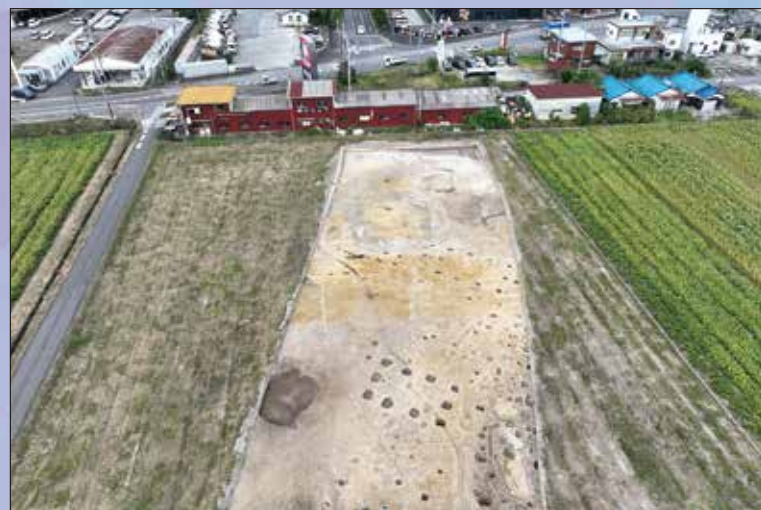
奈良時代の郡衙関連建物（御館前遺跡）