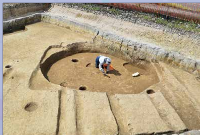
弥生時代の竪穴建物（岩畑遺跡）

瓦キーホルダーづくりや勾玉づくりのほか、 整理作業の体験もできます。 さらに、発掘調査で見つかったモノを調査員 や大学生がくわしく解説！ 詳細は裏面へ！