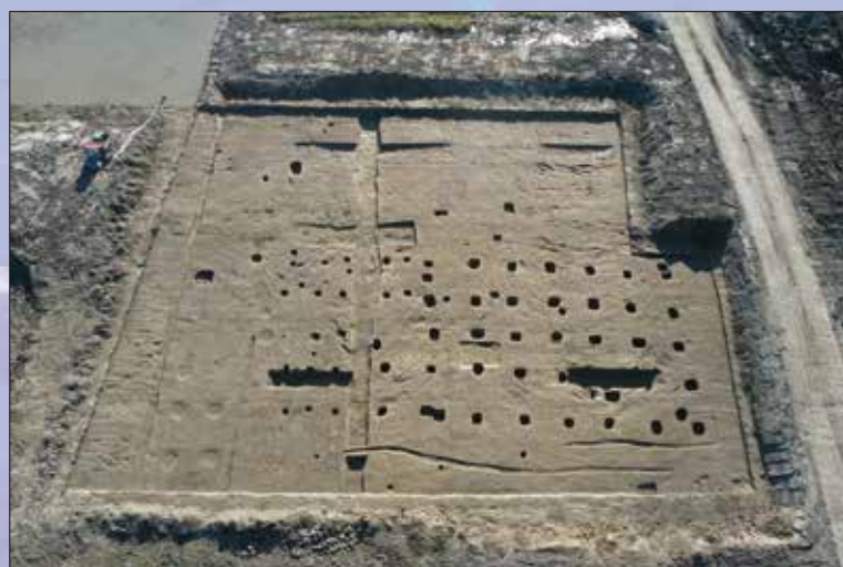
平安時代後期の集落跡（横江遺跡）