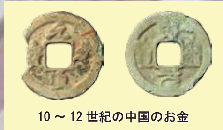
10～12世紀の中国のお金

今回の調査では、複数の土坑・小穴を検出し、それらに伴って室町時代に使われていた皿・すり鉢・羽釜などの土器などが出土しました。今回の調査範囲では、検出した遺構や出土した土器の年代観から、室町時代の一時期に人々の生活が営まれていたことが明らかとなりました。その後、明治時代にかけて水田化され、また自然流路の位置の移動を経て、現在景観ができあがったと考えられます。