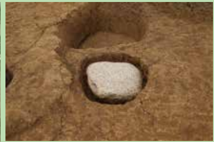
掘立柱建物と礎板石（建物の柱の沈み込みを防ぐための石）