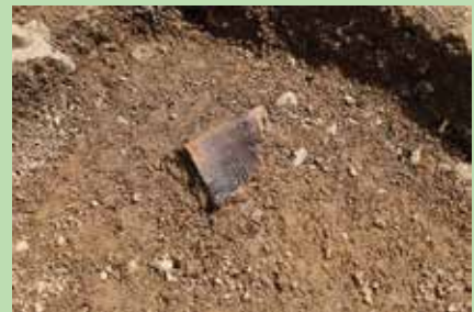
すり鉢が出土したようす