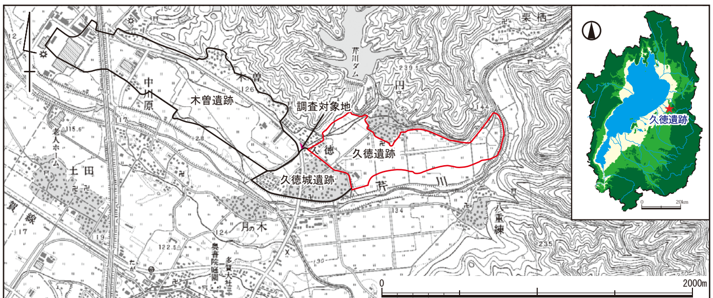
図1 久徳遺跡の位置と調査範囲

今回の調査では、掘立柱建物1棟と自然流路1条、複数の土坑・小穴などの遺構を検出しました。出土した遺物の年代観から、これらは室町時代(約600年前)の遺構と判断でき、当時の人々の暮らしの痕跡が明らかになりました。