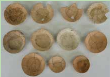
室町時代（約600年前）の土坑と はじきざら 出土した土師器皿