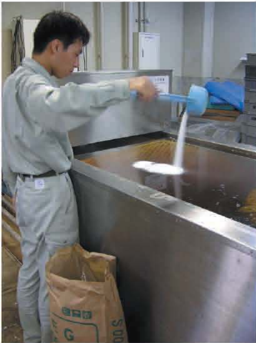
ポリエチレングリコールを投入