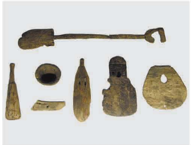
PEG含浸法で保存処理した農具・容器