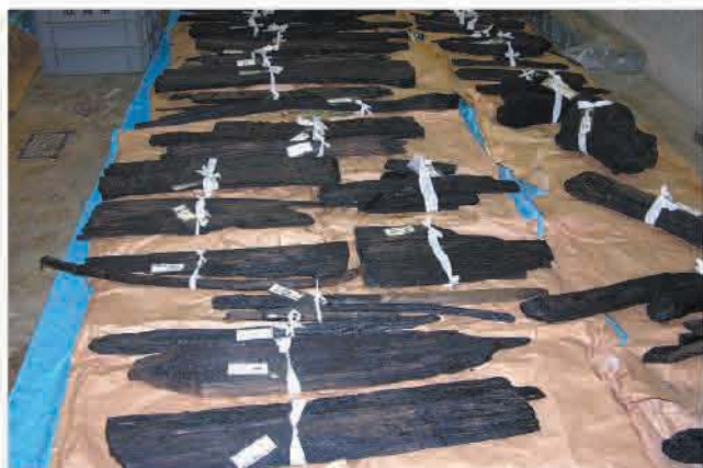
冷却・硬化中の大型木製品