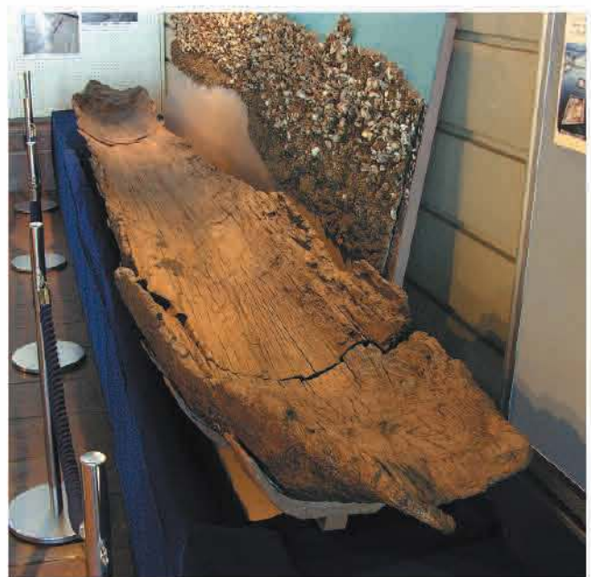
丸木舟(尾上浜遺跡出土/縄文時代後期~晩期)の展示 於 滋賀県埋蔵文化財センター