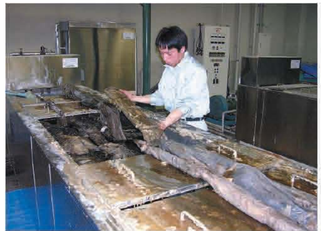
PEG含浸が終了し、含浸槽から取り出す