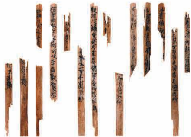
真空凍結乾燥法で保存処理した柿 こけりょう 経