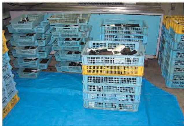
小型の木製品はカゴに収納して硬化させる