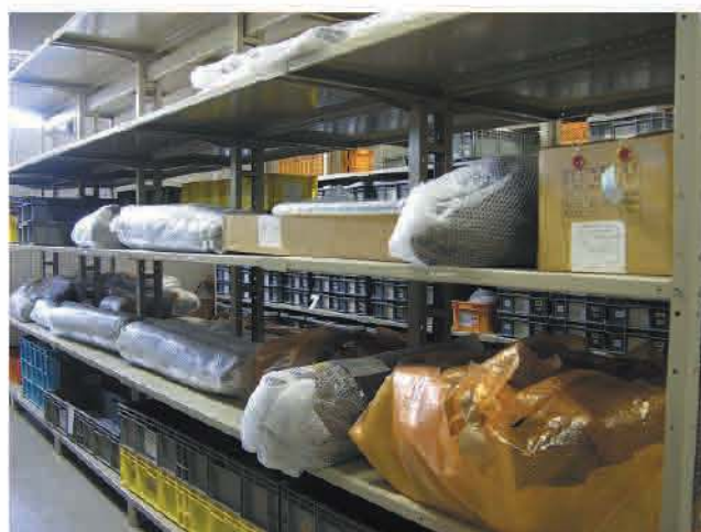
大型木製品の保管

保存処理の完了した木製品は、整理箱に収納したり、梱包材で包んで専用の収蔵室に保管します。