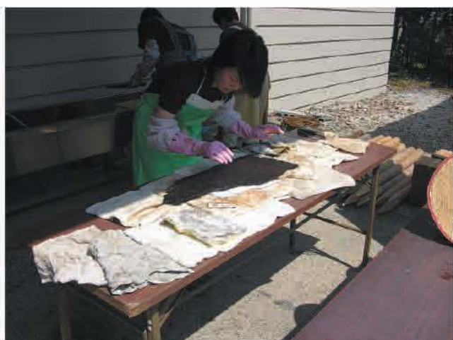
洗浄した後、表面の水分を吸収する