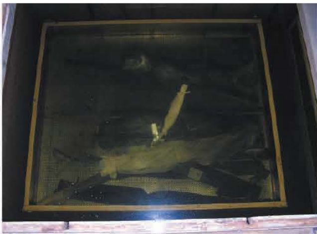
地下式の水槽で保管している大型木製品

出土木製品は、水を入れたコンテナに取められて発掘現場から埋蔵文化財センターに運ばれてきます。まず木製品の表面に付着している泥を水洗いし、計測や写真撮影などの記録作業を行います。その後、大きさごとにプラスチック製のカゴに収納して、地下式の水槽などで水に浸し保存処理の順番を待ちます。