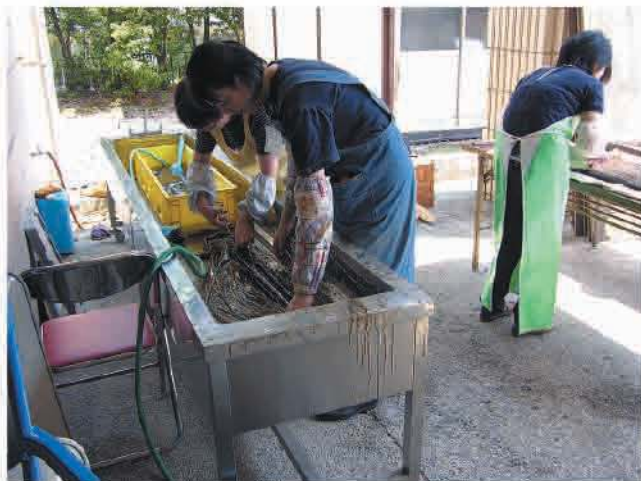
温水で表面のPEGを洗い流す

を防ぐために、表面に付着したPEGを温水で洗浄します。この作業のことを表面処理と呼んでいます。この時点での木製品は、まだ固まっておらず柔らかい状態をしているので傷つけないように注意が必要です。表面処理をした後は、布などで水分を吸収します。