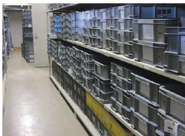
小型木製品は整理箱に収納して保管している