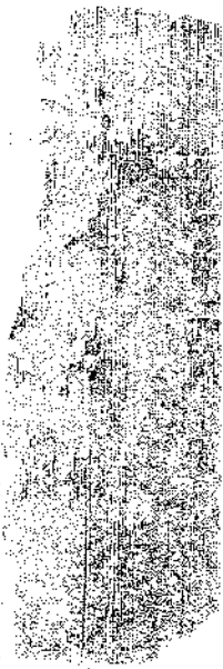
図版1 巡礼札No. 5 (表面)