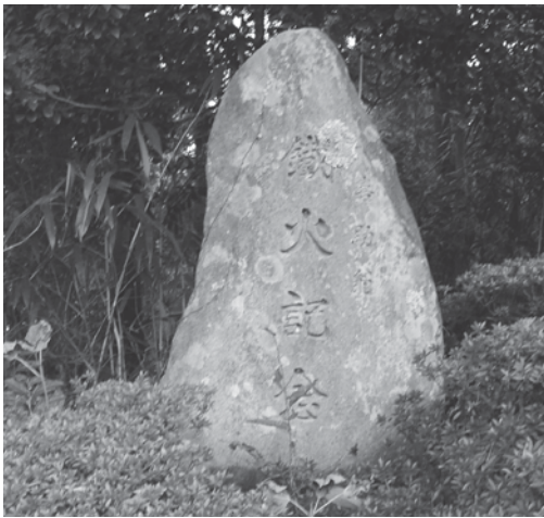
写真1 雲迎寺鉄火碑