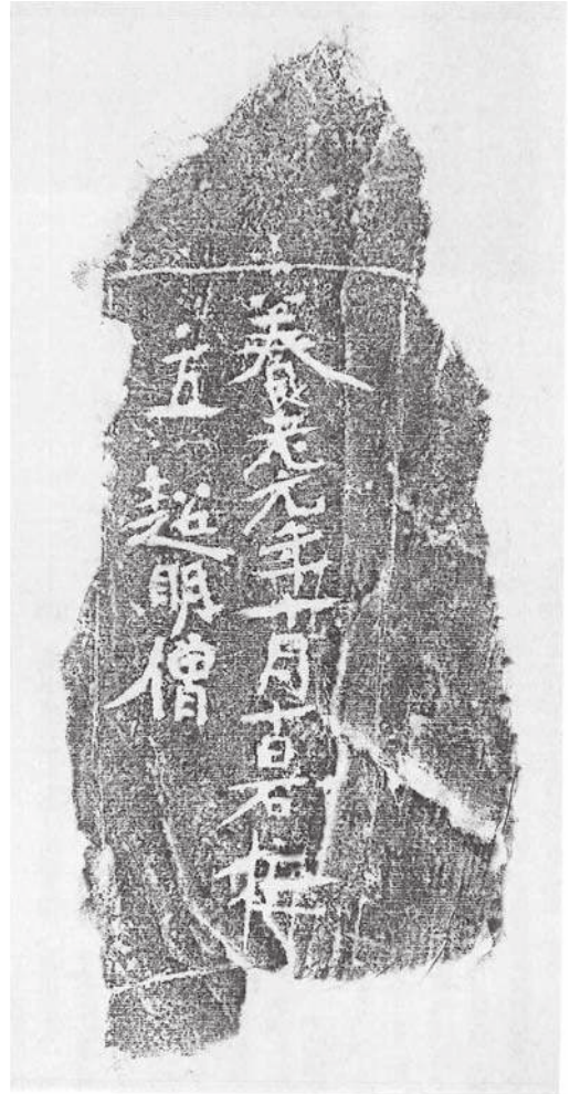
図2 超明寺石碑拓本