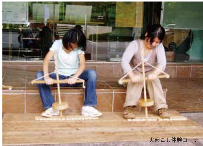
火起こし体験コーナー