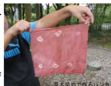
草木染めで作るハンカチ

会場:滋賀県埋蔵文化財センター 定員:各イベント10名(先着順・要予約) 参加費:各イベント500円 その他:①は小学校5年生以上、 ②・③・④は小学生以下 の場合、保護者同伴。 申込先:財団法人滋賀県文化財保護協会 (077-548-9780)