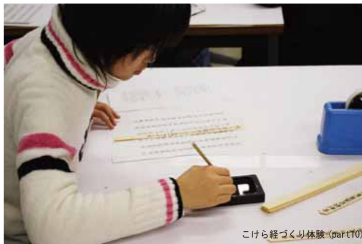
こけら経づくり体験(part10)

日時:平成22年8月22日(日)9:00～17:00 会場:滋賀県立安土城考古博物館 1階整理室 内容:整理作業体験(随時受付・参加料無料) 整理作業室特別公開・出土品展示等 入場料:無料(但し、博物館常設展・企画展の見学は有料です) 問合せ先:財団法人滋賀県文化財保護協会 調査整理課(0748-48-4861)