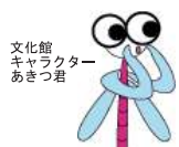
文化館キャラクター あきつ君

■琵琶湖文化館では、滋賀県教育委員会との共催で、文化財講座を開催しています。滋賀の文化財についての最新情報を紹介するこの講座は、毎回定員を超える人気講座となっています。興味のある方は是非お気軽にご参加下さい。