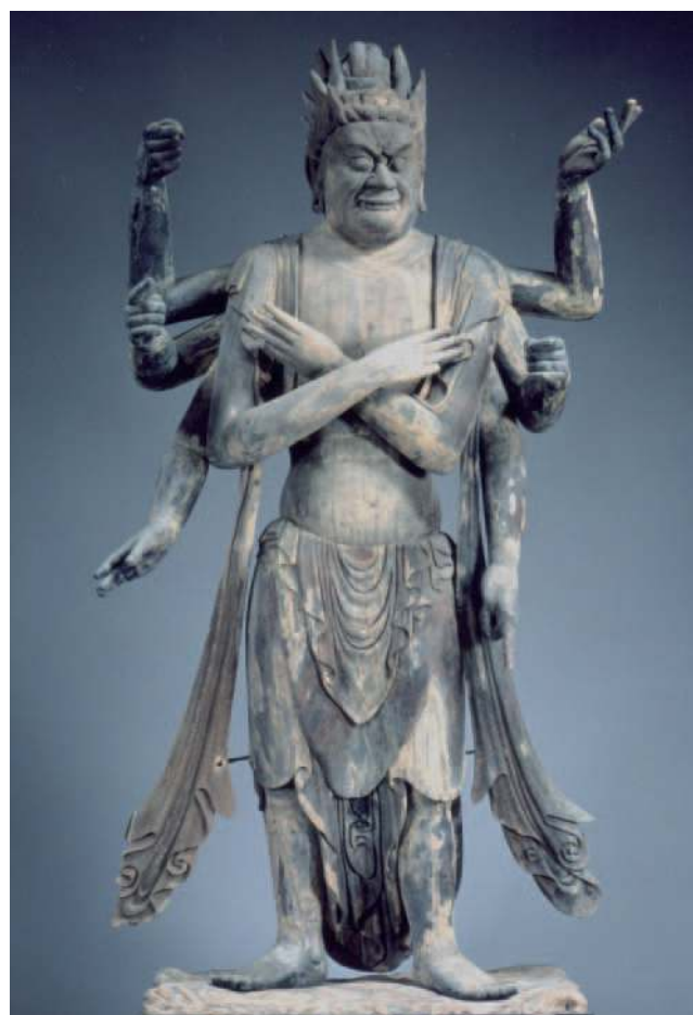
重要文化財 木造軍荼利明王立像 平安時代 金勝寺（滋賀県栗東市）

■白洲正子（1910—1998）は、各地の社寺を訪れ、日本の伝統的な美意識と神概念、仏教との関係などを探求しました。とりわけ、近江の地は正子を強く引きつけ「隠れ里」を始めとする数々の作品の中に登場します。今回、滋賀県立近代美術館での生誕100年記念特別展の開催に協賛し、正子の愛した近江の文化財を広く紹介する講演会と文化財探訪を企画しましたので、ご案内いたします。