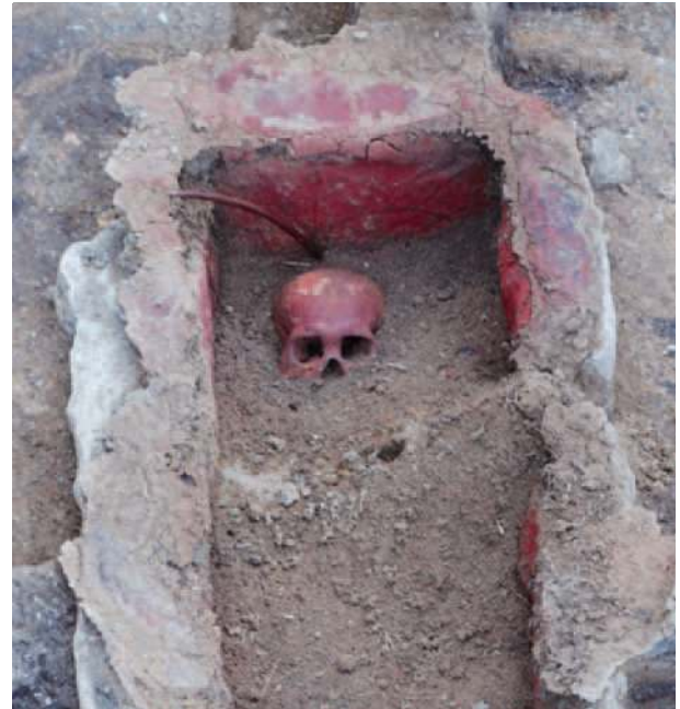
●蓋をあけた直後の頭蓋骨。蓋石を開けると、赤色顔料で真赤になった頭蓋骨が現れました。片山一造先生(京都大学名誉教授)の鑑定によると、20~40代の男性であるとわかりました。石棺の規模からみて、被葬者は小柄(約160cm)な人物であったとみられます。この地域の有力者だったのでしょうか。

*宇佐山城遺跡の現地説明会資料は、当協会ホームページ( http://www.shiga-bunkazai.jp/ )からダウンロードできます。